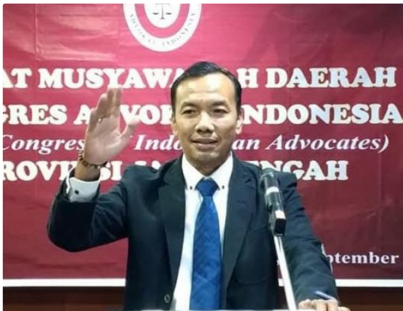
Foto: Kuasa Hukum PT Tata Usaha Versluis, Advokat Rois Hidayat, SH., C.Measa Hukum PT Tata Usaha Versluis, Advokat Rois Hidayat, SH., C.Me.